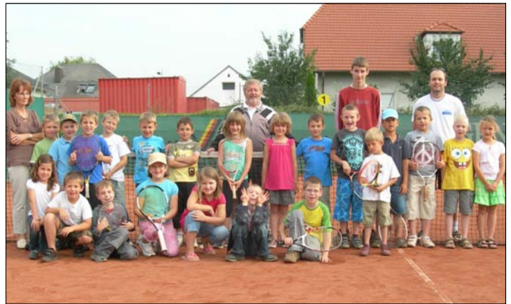
Schnupperstunde der Volksschule