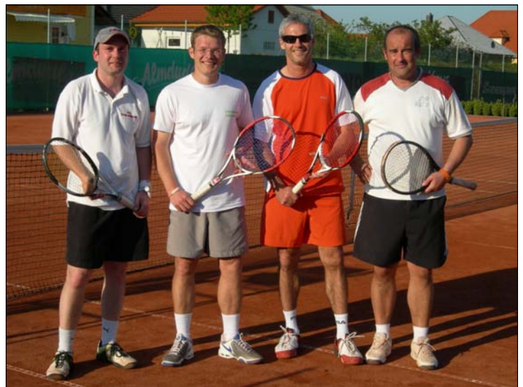
Besuch von Michael Konsel: Ganz Österreich spielt Tennis!